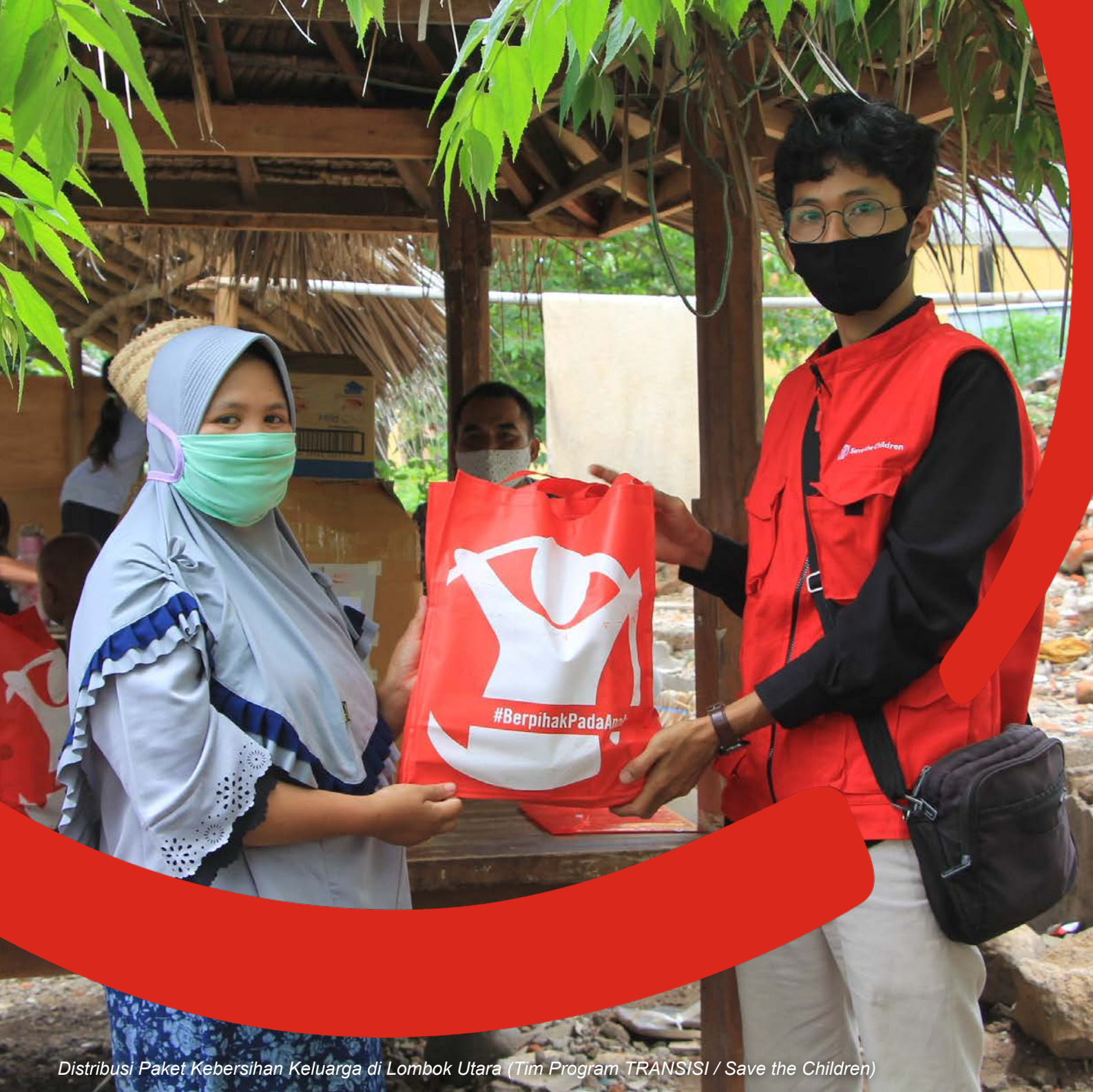
Distribusi Paket Kebersihan Keluarga di Lombok Utara